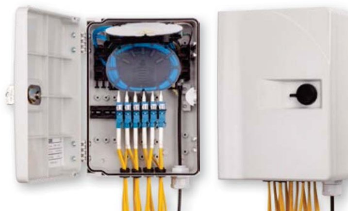
URM SH 24C